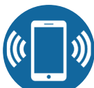
N° DE TÉLÉPHONE