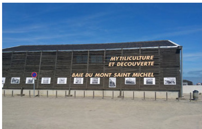
La Maison de la Baie