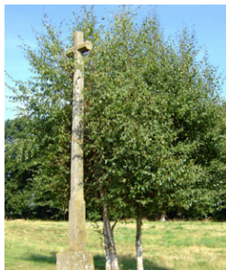
La Croix du Coucou

Est une croix de mission, érigée en 1884 lors d'une campagne d'évangélisation. Ces missions ont existé jusqu'en 1955 à Épiniac. Elles avaient lieu tous les 5 ans et se terminaient ordinairement par l'établissement d'une croix, souvent érigée par des notables qui faisaient graver leurs noms sur le socle.