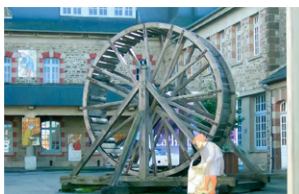
La roue du Cathédraloscope

La ferme pédagogique du Lycée des Vergers compte 148 hectares sur lesquels on trouve des vaches laitières, des porcs Bio ainsi qu'un petit élevage de buffles. Afin de valoriser la production laitière en circuit court et dans l'objectif de former les élèves, un atelier de transformation est annexé à la ferme avec production de yaourts et lait pasteurisé.