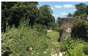
La promenade des Remparts

Fluve côtier prenant sa source à Cuguen et se jetant en baie de Cancale, le Guyoult fut dévié au 13 e siècle au moyen d'un canal artificiel empruntant le plus court chemin de Dol-de-Bretagne à la mer. Autrefois, au moins 6 moulins à eau se situaient sur son cours ; au fil des siècles, son lit a fréquemment été modifié pour les usages de l'Homme.