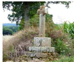
Croix de la Mancelière