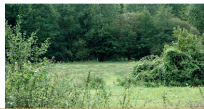
Zone humide à Choiseul

Ces zones humides ont également une fonction épuratrice puisqu'elles filtrent les flux de nutriments et de polluants, ce qui est bénéfique pour la qualité des eaux de nos rivières.