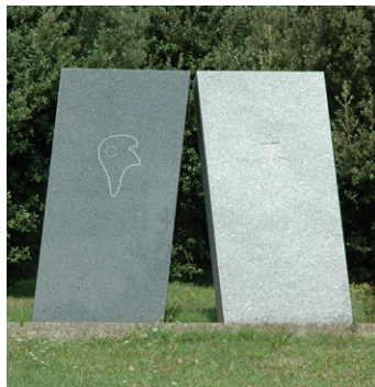
Monument à Choiseul

Par deux fois, la région doloise connaît le passage des Vendéens de la Virée de Galerne. Au retour, après leur défaite à Granville, ils se rassemblent à Dol-de-Bretagne sous l'autorité de La Rochejaquelein. Les Républicains attendent et les encerclent à distance. Du 20 au 22 novembre 1793, les combats sont furieux et meurtriers entre les Blancs et les Bleus de Kléber, Marceau et Westermans. Les alentours de Choiseul sont témoins d'âpres combats. La bataille se soldera