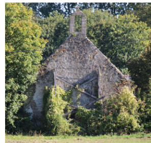
Chapelle de la Mancelière