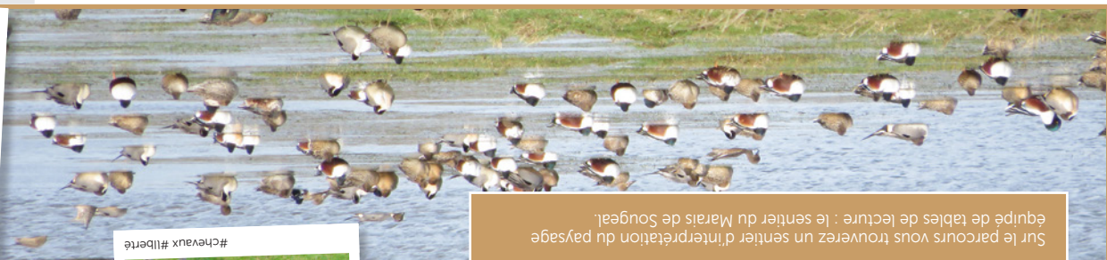
Sur le parcours vous trouverez un sentier d'interprétation du paysage équipé de tables de lecture : le sentier du Marais de Sougeal.