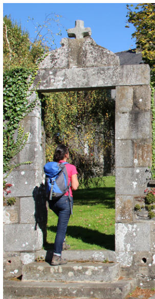
Portail du Presbytère

La commune est traversée, entre le presbytère et la Maison St-Thomas de Villeneuve, par une ancienne voie romaine reliant Avranches à Corseul. Ce presbytère transformé en appartements est relativement récent. La Maison St-Thomas de Villeneuve, transformée en maison de retraite, était à l'origine un pensionnat de jeunes filles tenu par des religieuses.