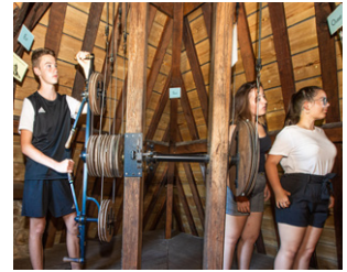
Manipulation du mécanisme du télégraphe.