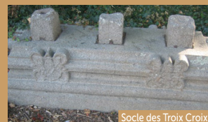
Socle des Trois Croix