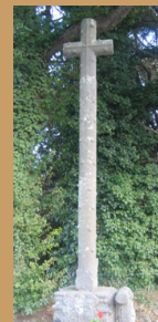
Calvaire du Prieuré