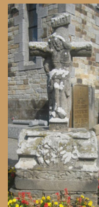
Calvaire du vieux cimetière