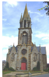
Eglise de Carfantin

Samson, moine du Pays de Galles, aurait débarqué vers 548 au niveau de l'embouchure du Guyoult. Selon la tradition, il aurait fondé un monastère près de la fontaine de Carfantin (nommée aujourd'hui « fontaine Saint Samson ») afin d'évangéliser toute la région. Au 6 e siècle, il joua un rôle primordial dans la fondation de la cité de Dol-de-Bretagne et de son évêché. Il mourra en 565 à Dol-de-Bretagne après avoir désigné Magloire comme successeur. Aussitôt, son tombeau devint l'objet de nombreux pèlerinages. L'église de Carfantin (19 e s.), reconstruite sur les vestiges d'une église médiévale, est marquée de chaque côté du porche par 2 statues de Saint Samson et de Saint Magloire. Carfantin (de Kerfeuten, village de la fontaine) fut rattaché à Dol en 1794.