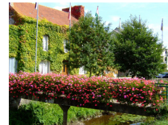
La passerelle du Guyoult

6 Après la ferme de la Barattière, tourner à droite en direction des Landes. Passer devant la maison et poursuivre le long d'un champ avant d'arriver dans un chemin creux en sous-bois. Arrivé sur la RD 80, prendre à droite. Au carrefour de la Lande Gretay, tourner à droite vers le bourg de Baguer-Morvan. Au virage, tourner à droite dans un chemin piérré. A l'angle de la maison, descendre à gauche dans un chemin creux puis tourner à droite pour regagner le bourg. Après la voie ferrée, vous pouvez observer le calvaire de la Hirlais ainsi qu'une belle chaumière (privée) et une grotte. Contourner un plan d'eau avant de rejoindre l'église.