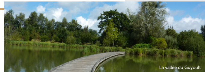
La vallée du Guyoult

2 Longer la RD 8 à gauche, traverser la RD 676 ( calvaire du Bois au Coq ) et reprendre la RD 8 en direction de Roz-Landrieux puis tourner à droite vers la Planche. Poursuivre tout droit, traverser le hameau de Cardequin et emprunter un chemin de terre à gauche. A l'intersection, après la ferme de L'Aunay Bégassa, tourner à gauche puis reprendre à gauche vers La Morlais. Vous cheminez à travers le marais noir ( panorama sur le Mont-Dol et la cathédrale Saint-Samson ).