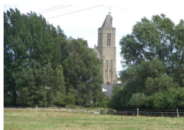
Le marais et la cathédrale de Dol-de-Bretagne

Le territoire intercommunal a la particularité d'offrir au regard une palette de paysages qui diffère en l'espace de quelques kilomètres. Ainsi, le circuit du Clos Chapelle nous permet d'alterner entre la découverte d'un paysage vallonné, marqué par les haies bocagères et les talus, et un paysage aéré du marais de Dol, sillonné par son vaste maillage de canaux et de fossés ponctué par l'omniprésence du Mont-Dol et de la Cathédrale de Dol-de-Bretagne.