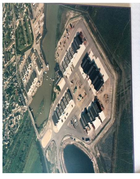
VUE AERIENNE DU PORT